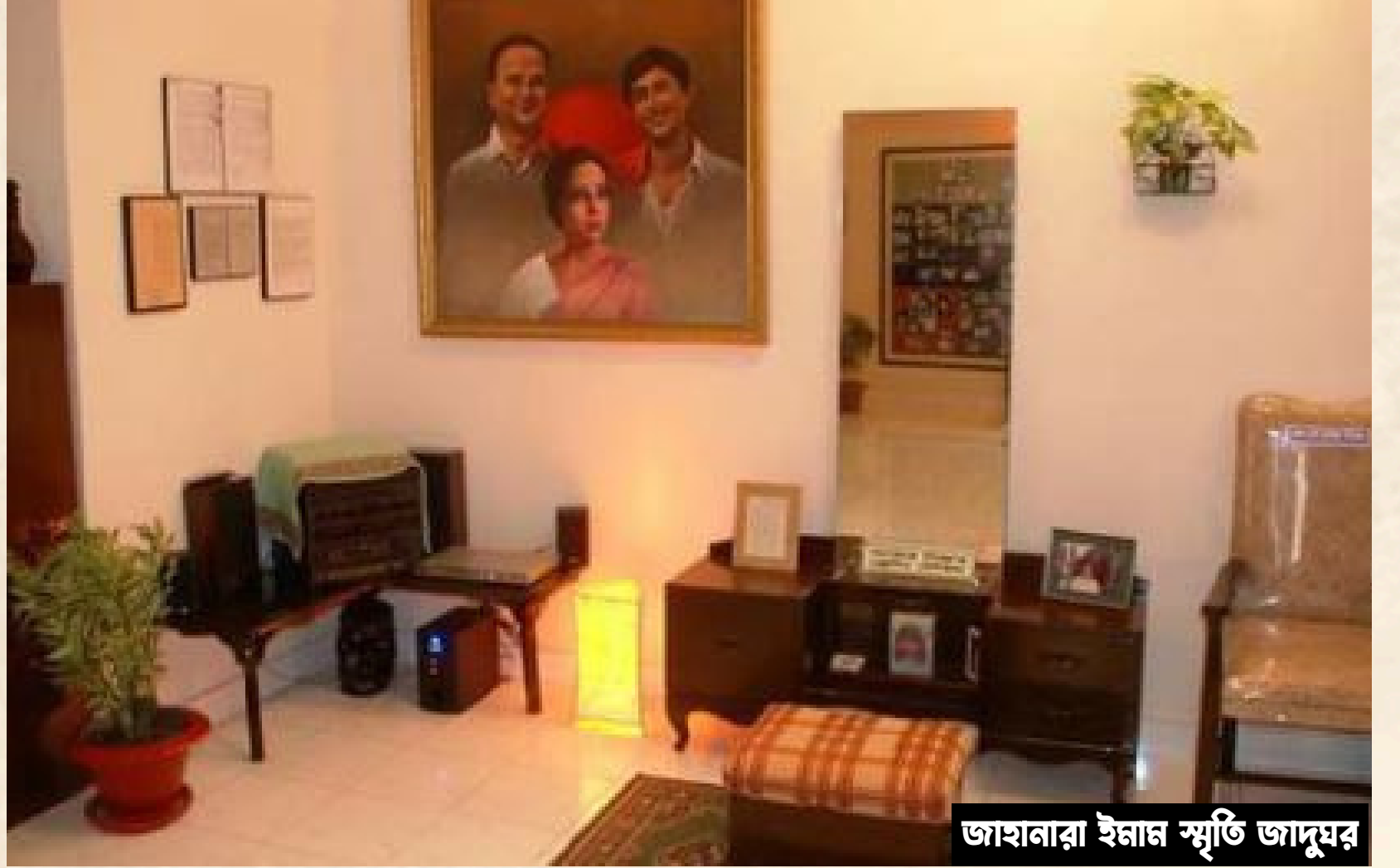
জাহানারা ইমান স্মৃতি জাদুঘর