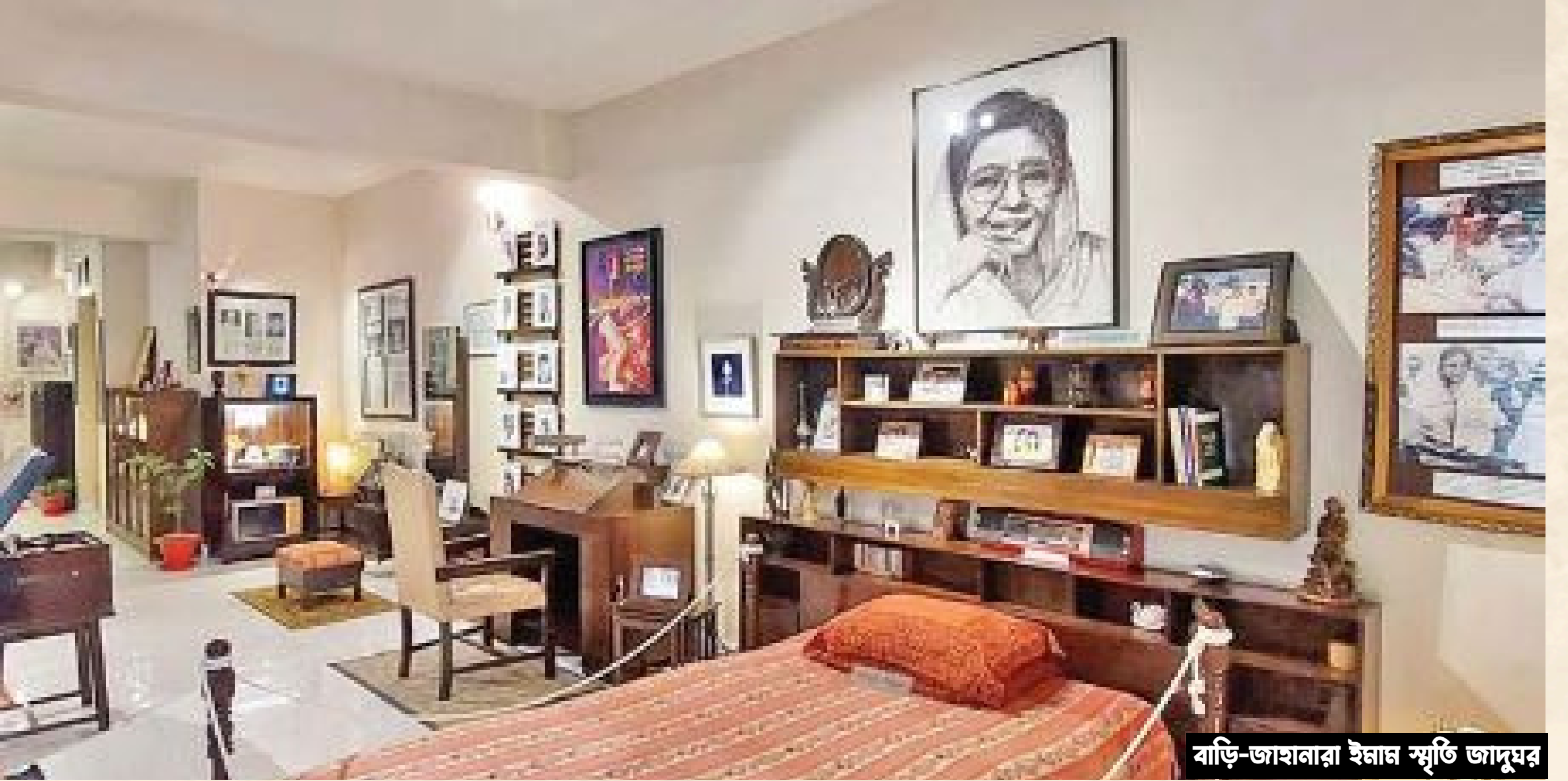
বাড়ি-জাহানারা ইমাম স্মৃতি জাদুঘর